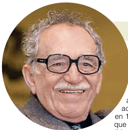
GABRIEL GARCÍA MÁRQUEZ Escritor y periodista (1927 - 2014)

Además de santa Madre Laura Montoya, Colombia también cuenta con los beatos Luis Variara y Mariano de Jesús Euse Hoyos , reconocidos por parte de la Iglesia Católica.