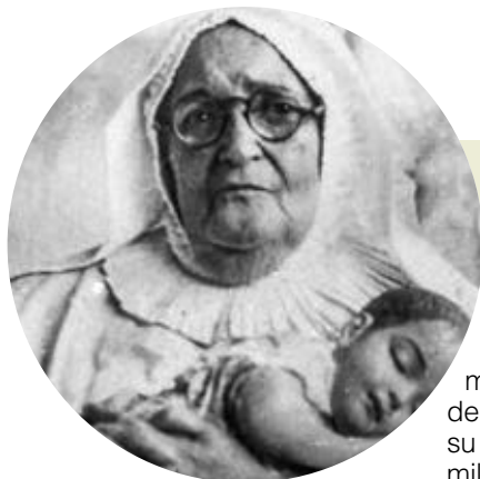
LAURA MONTOYA Educatora y misionera cristiana (1874 - 1949)