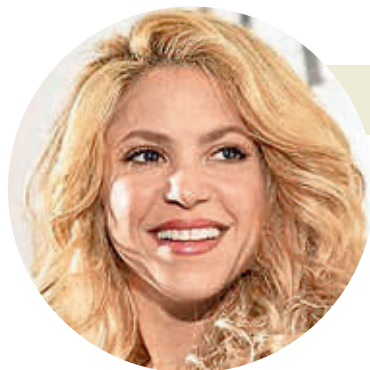
SHAKIRA ISABEL MEBARAK Cantautora