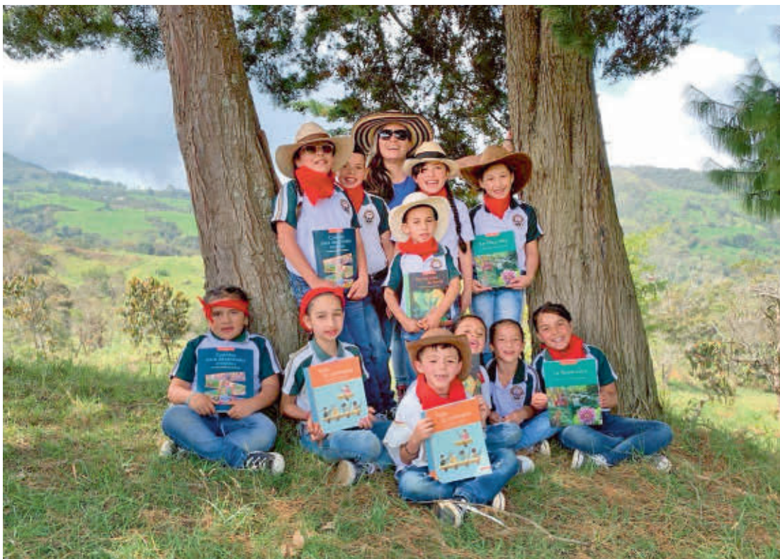
Hasta 2020, la fundación había entregado 6.637.027 libros, sobre todo en Antioquia.

Escanee el código QR y descubra más historias de colombianos ejemplares y cómo postular nuevos.