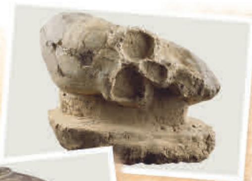
Cerámicas y restos óseos notablemente conservados se han encontrado en la mayoría de las obras.

19. Perimetral de Oriente de Cundinamarca Se identificaron 3 sitios arqueológicos de gran relevancia. El más grande de estos tiene un área aproximada de 1.260 metros cuadrados.