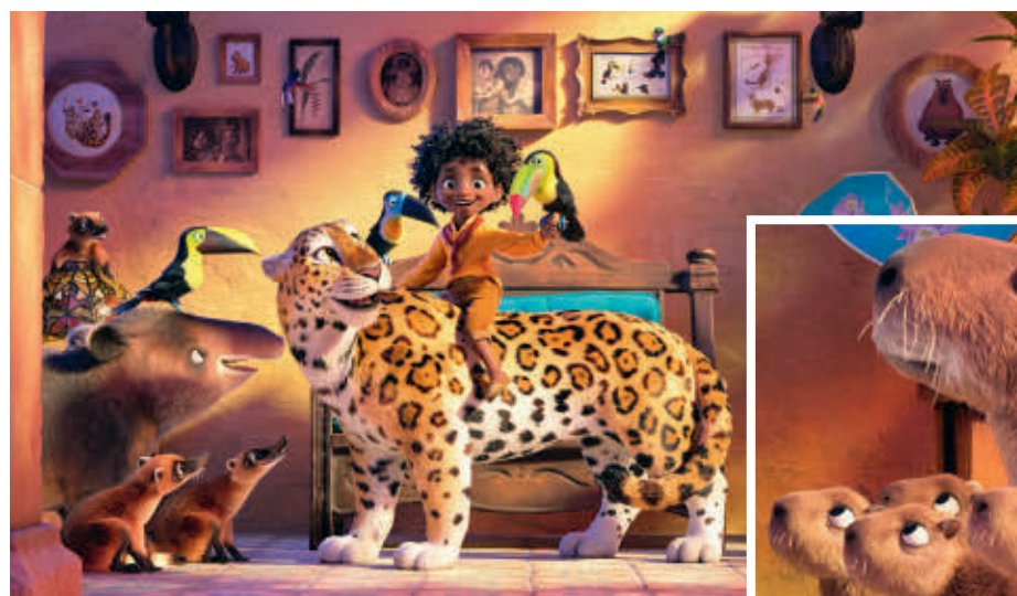
LOS CHIGÜIROS HARÁN PARTE DE LA MANADA DE ENCANTO

Es altivo, elegante, de mirada incisiva. Serio. Si pudiera hablar, probablemente no lo haría mucho. Parece un sabio, como si llevara auestas todo el peso de la historia y del pasado y muchos secretos que le han contado. Es un fósil. Uno viviente. El chigüiro es uno de los animales protagonistas de la nueva película de Disney ambientada en Colombia, Encanto, que tuvo el miércoles su estreno mundial pero que solo llegará al cine el próximo 25 de noviembre.